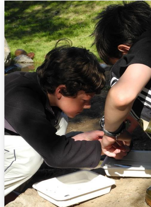
PROJEKTE - ÖKOINSTITUT